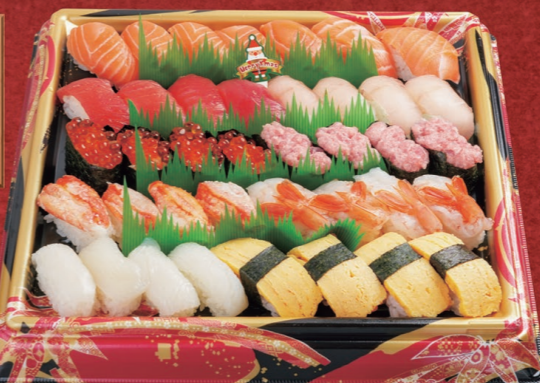
77 ファミリー握り寿司 40貫 3,980円 1パック (税込4,299円)