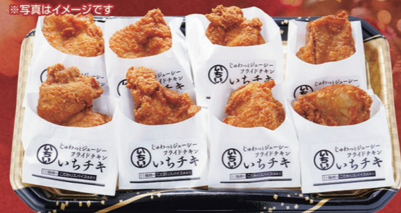
66 ジューシーフライドチキン いちチキ 1,380円 8コ入 (税込1,491円)