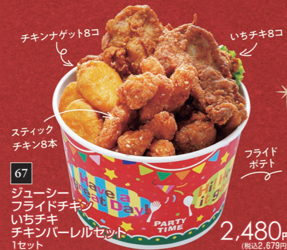
67 ジューシー フライドチキン いちチキ チキンバーレルセット 1セット 2,480円 (税込2,679円)