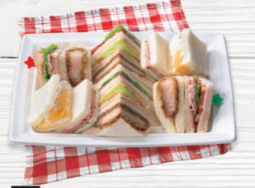
75 ヤマザキ パーティサンド 1パック 1,200円 (税込1,296円) 12月8日@締め切り