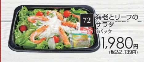
72 海老とリーフの サラダ 1パック 1,980円 (税込2,139円)