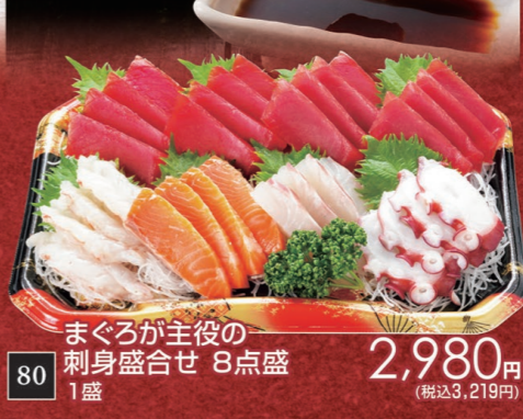
80 まぐろが主役の 刺身盛合せ 8点盛 2,980円 1盛 (税込3,219円)