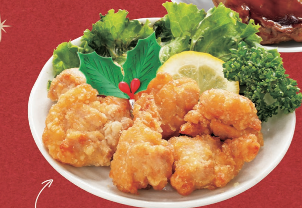
鶏もも 竜田揚げ6コ