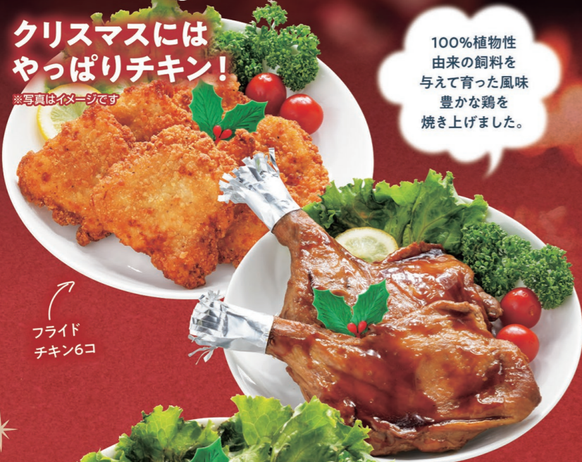
フライド チキン6コ