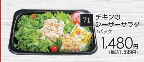
71 チキンの シーザーサラダ 1パック 1,480円 (税込1,599円)