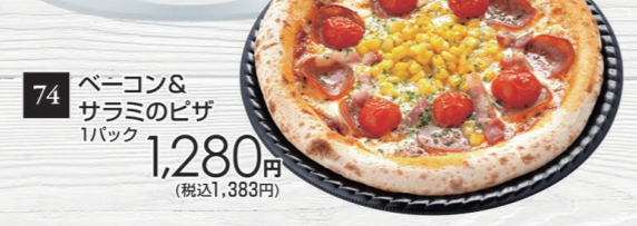
74 ベーコン& サラミのピザ 1パック 1,280円 (税込1,383円)