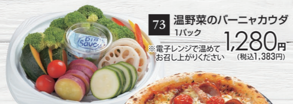
73 温野菜のパーニャカウダ 1パック 1,280円 (税込1,383円) ※電子レンジで温めて お召上がりください