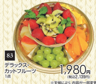
83 デラックス カットフルーツ 1点 1,980円 (税込2,139円)