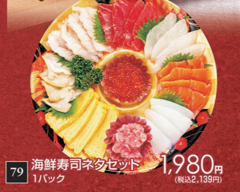
79 海鮮寿司ネタセット 1,980円 1パック (税込2,139円)