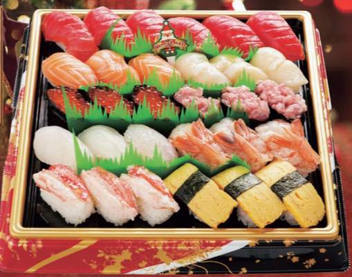
76 宇和島産 養殖生本マグロ入 握り寿司 30貫 3,980円 1パック (税込4,299円)