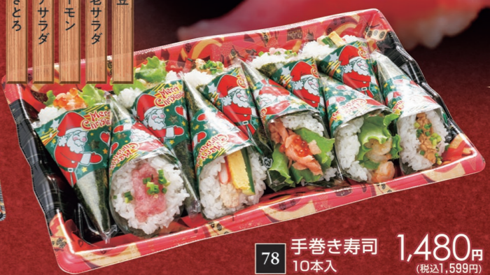
78 手巻き寿司 1,480円 10本入 (税込1,599円)