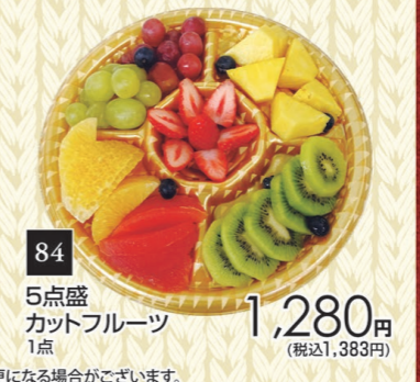
84 5点盛 カットフルーツ 1点 1,280円 (税込1,383円)