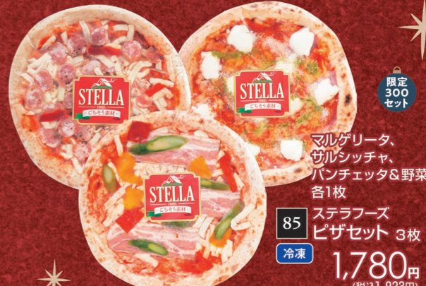
85 冷蔵 ステラフーズ ピザセット 3枚 1,780円 (税込1,923円) マルゲリータ、 サルシッチャ、 パンチェッタ&野菜 各1枚